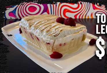
TORTA TRES LECHES